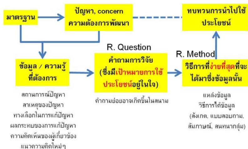
ภาพที่ 1 แนวคิดและแนวทางการทำ Mini-research

เป็นการประยุกต์แนวคิดของการวิจัยมาใช้ในการประเมินสถานการณ์หรือผลลัพธ์ของการพัฒนา โดยสามารถสรุปข้อมูลหรือความรู้ที่ต้องการได้ในเวลาอันสั้น สามารถนำข้อมูลหรือความรู้นั้นไปใช้ประโยชน์ได้อย่างรวดเร็วทันการณ์